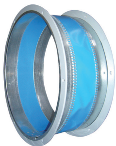
Flangia a soffietto Circular flexible flange

Made in aluminium, they are widely used to connect the blower with the damper.