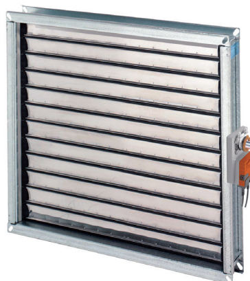
Serrande taglia fumo Smoke dampers

Used for the abatement of the sound pressure. Available in galvanized steel or Stainless steel (with internal ogive on request).