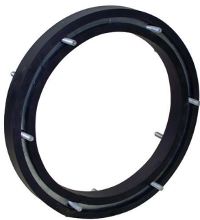
Anello antivibrante Vibration damping ring

Anello antivibrante flessibile, costruito in gomma EPDM, con doppia flangia interna in acciaio INOX, comunemente usato per assorbire le vibrazioni e di conseguenza ridurre il livello di rumorosità generato dal ventilatore in funzione.